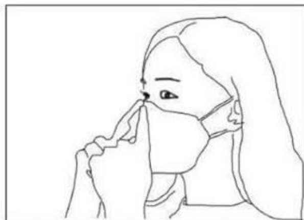
Agganciare gli elastici dietro alle orecchie. Conformare lo stringinaso facendolo aderire ai contorni