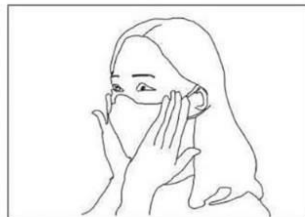
Premere leggermente per ottenere la migliore aderenza possibile anche sulle guance e sotto il mento

Rimuovere la mascherina evitando il contatto con la parte interna.